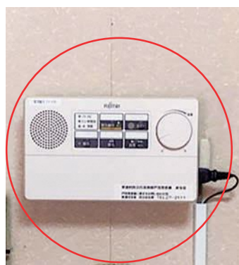
②【壁に取付ける場合】