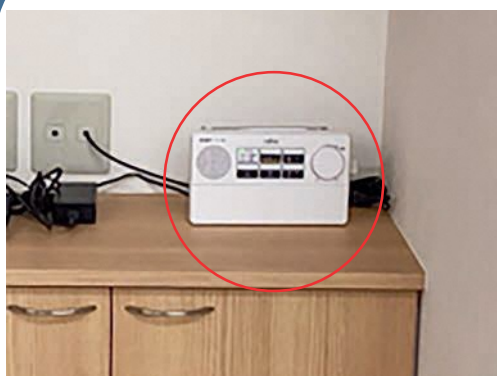
①【電話台等に置く場合】