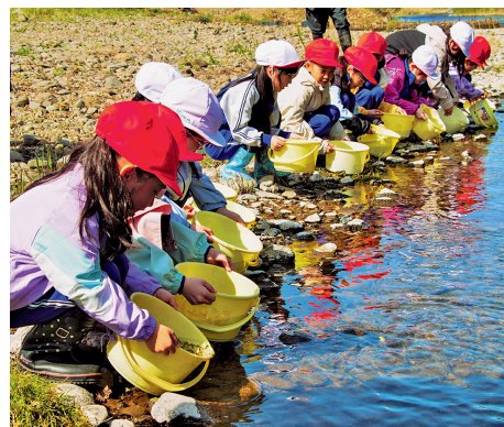
稚魚放流体験をする、こどもたち