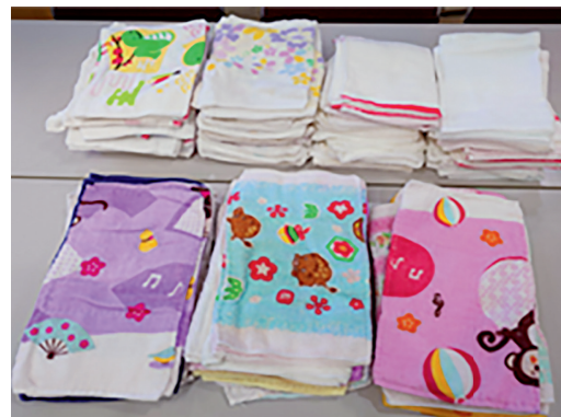
寄贈された彩り鮮やかな手作り雑巾

「エプロン会」の皆様には、これまでも手作り雑巾を寄贈していただいております。心より感謝申し上げます。