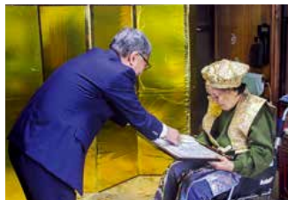
村長より顕彰状と祝金の授与