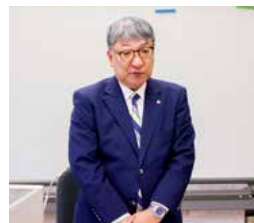
会長(畑中村長)挨拶