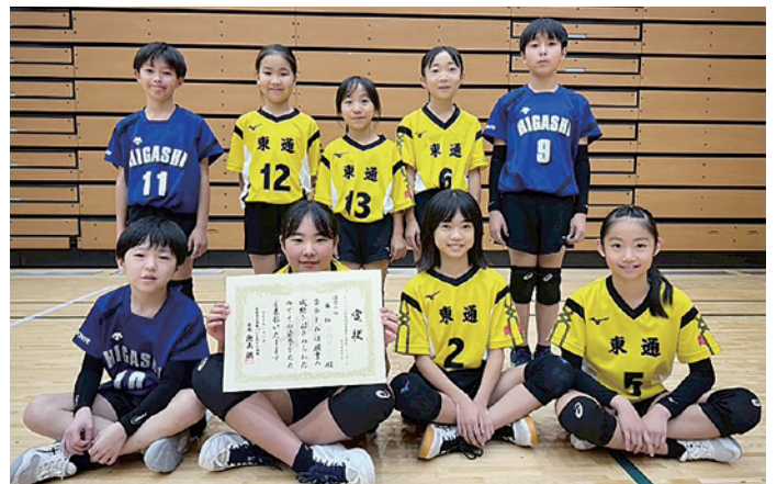
アシックス杯第42回青森県小学生バレーボール新人交歓会 第3位