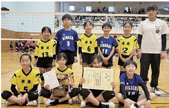
第24回領毛杯小学生バレーボール選抜交流大会 優勝