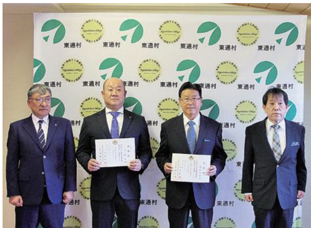
左から畑中村長、大槻さん、丹内さん、加藤副本部長