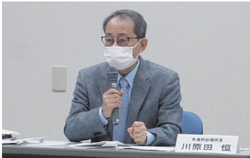
委員のご質問やご意見

村としても、これらの状況を踏まえ、今後も、村民の安全と安心のため、全力で取り組んで参ります。