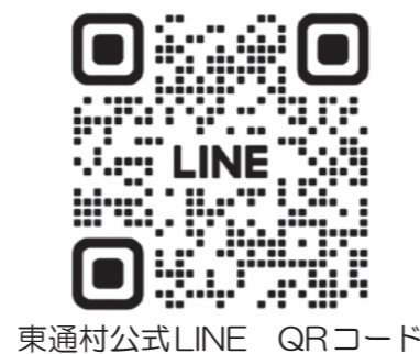
東通村公式LINE QRコード