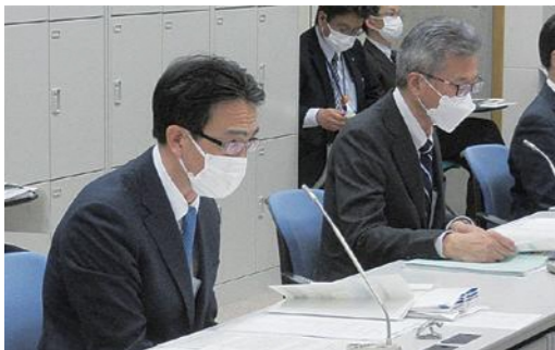
東京電力HD(左)・東北電力(右)の説明