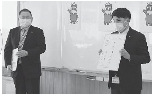
説明をする両郵便局長