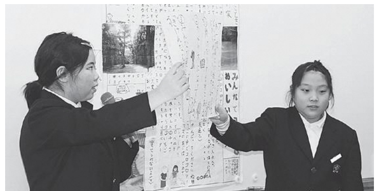
壁新聞を浮間小学校5年生に発表