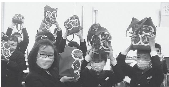
「自分たちが収穫した寒立米！最高！！」