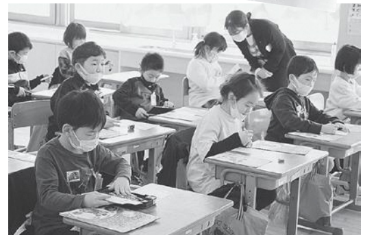
それぞれ自分なりの絵を描きました