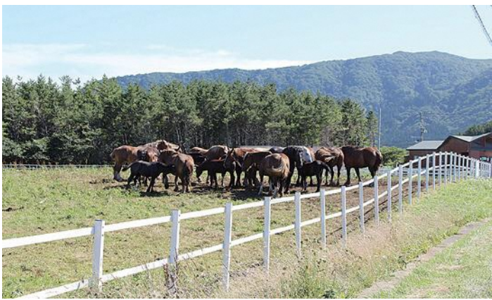
県天然記念物 寒立馬とその生息地