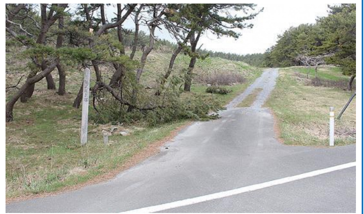
国史跡 尻尻屋貝塚