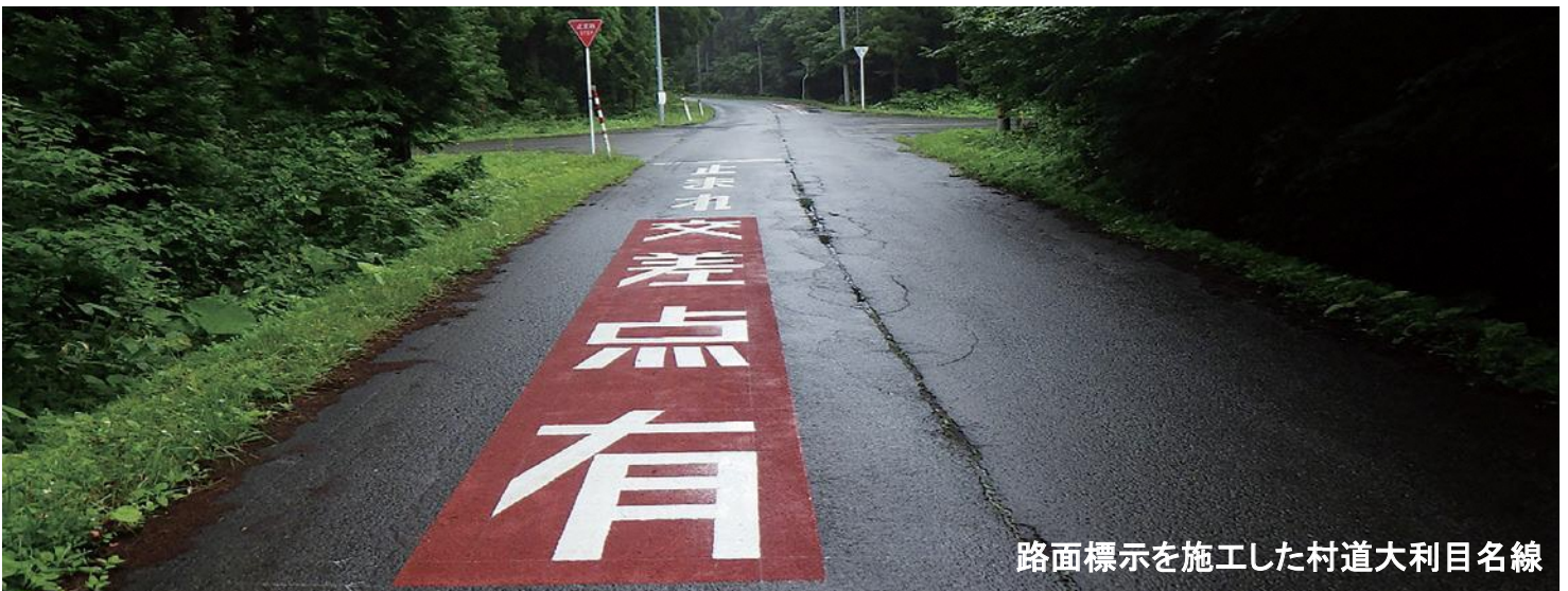
路面標示を施工した村道大和目名線