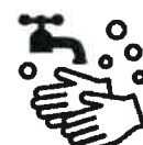
石けんによる 手洗い