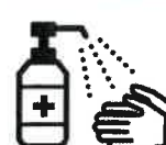
手指消毒用アルコール による消毒の励行

新型コロナワクチンの有効性・安全性などの詳しい情報については、厚生労働省ホームページの「新型コロナワクチンについて」のページをご覧ください。