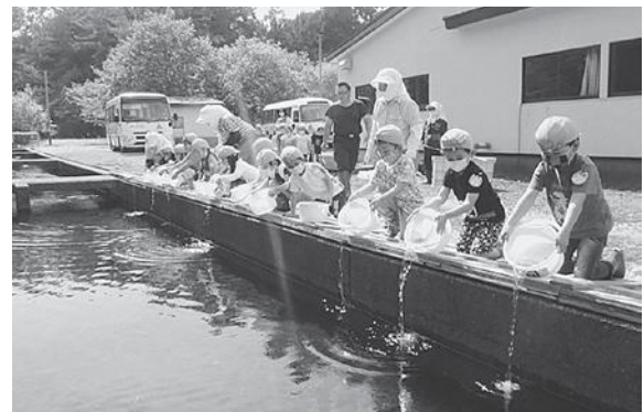
サクラマス稚魚を放流する5歳児