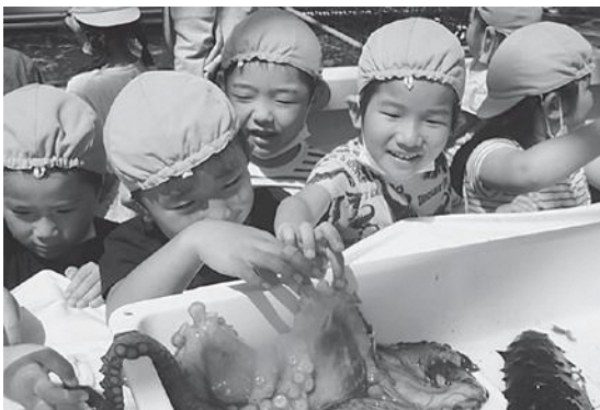
海の幸に触れる5歳児

両施設での幼児達は、「あわびはどこに放流するの?」、「サクラマスは海へ行って川に戻るまで何年かかるの?」と説明してくれた職員にたくさん質問を投げかけていました。