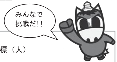
【東通村総人口の将来展望】