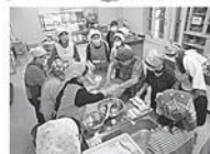
手作りこんにやく