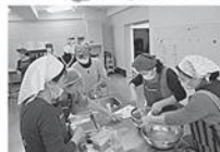
ところてん&寒天スイーツ