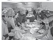
仕込み味噌づくり

「食改さんの料理教室」の様子をご紹介します。これからも楽しい教室を企画したいと思います。興味のある方はご参加ください!