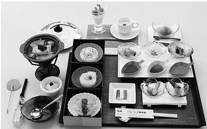
完成した「東通天然ヒラメ刺身重」リニューアル新バージョン

試食された関係者からは、「見た目がかきれいだ」「上品な味だ」「前より良く仕上がっている」といった声が上がりました。 新たなヒラメ重は、食前スープを地場産のジャガイモとほうれん草を使った2色の温かいポタージュスープに、歓迎の一皿は東通牛の煮込みと、天然ヒラメ特製三段重のご飯ものは、「ちらし重」「塩辛重」「味噌カツ重」に変更し、ファイヤークルメの「天然ヒラメとタコの熱々アリアパツツア」はリゾート風でも味わえるようになりました。デザートは、地場産イチゴのソースをかけた。値段は1食1,900円(税込)。