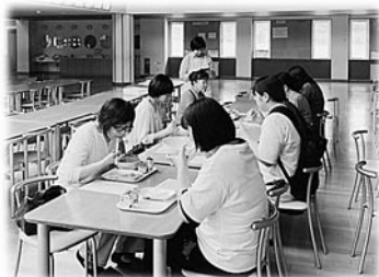
《給食試食会の様子》