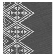
限定版 菱刺し模様