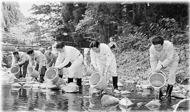
関係者による放流

今年で22回目となるこの放流事業はサクラマス漁獲量の増大を目的に行っている事業であり、村としても「つくり育てる漁業」の重要な魚種として、今後も資源の増大を図っていきたいと考えています。