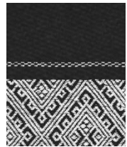
限定版 こぎん刺し模様

※ 予約された方には手帳が入荷次第ご連絡の上、代金引換にてお受け取りいただきます。