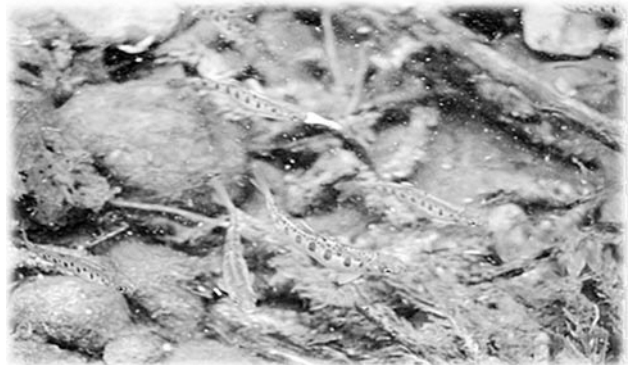
放流されたサクラマス稚魚