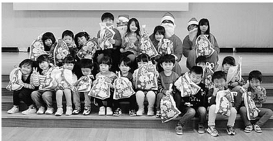
サンタクロースと記念撮影

12月25日(火)、こども園ひがしどおりクリスマス会が開催されました。キャンドルサービスやフォークダンスなど楽しんだ後、サンタクロースが登場。歓声の中迎えられ、入場しました。園児からの質問に答え、その後、一人一人プレゼントの贈呈と写真撮影を行いました。 今回のサンタクロースは、東通村商工会青年部の事業として部員が行っており、今年で2回目となります。こども園ひがしどおりには、20冊の絵本の贈呈を行いました。