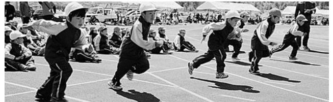
ライバルたちに負けじと全力疾走