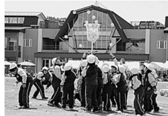
皆で力を合わせた玉入れ

の結果は赤組の優勝でしたが、どちらのチームも仲間と力を合せ、全力を出し切っていた様子でした。 3年生が中心となり、勝利のために力を合わせた生徒たちの頼もしい姿がありました。 赤組と青組に分かれた生徒たちは、学年種目や縦割り種目、抜きつ抜かれつの大接戦となったり、甲乙つけがた