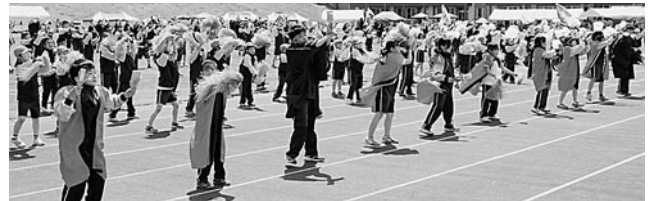
皆でよさこいソーラン披露