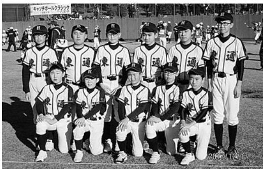
キャッチボールクラシック全国大会で健闘した東通イースターズのメンバー

12月17日（日）、東京都八王子市の中央大学多摩キャンパスで、全国小中学生740名が集まり「キャッチボールクラシック2017全国大会」が行われ、東通イースターズ（東通小学校野球部6年生）は、青森県代表として参加しました。 キャッチボールクラシックは、1チーム9名が5名と4名に別れ、7メートル離れてキャッチボールを2分間行い、その回数と正確さを競う競技です。 大会は、全国の予選を勝ち抜いた小学生40チームを4ブロックに分けて予選を行い、各ブロック上位4チームが2回戦へ進出し、2回戦を勝ち抜いた4チームが準決勝へと進むことができません。一方、敗者復活戦によって、負けたチームも準決勝へと進むチャンスがあります。 東通イースターズは、1回戦では硬さが見られ回数が伸びずに敗退しましたが、2チームで争う敗者復活戦へ回り、ここで初戦の失敗を繰り返さないようにと奮闘し、決勝進出チ