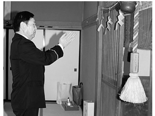
砂子又八幡宮にて無災害を祈願