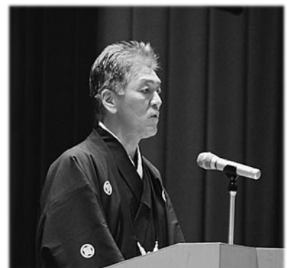
越善会長による挨拶