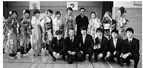
恩師や同級生との再会に笑顔が絶えない成人式でした