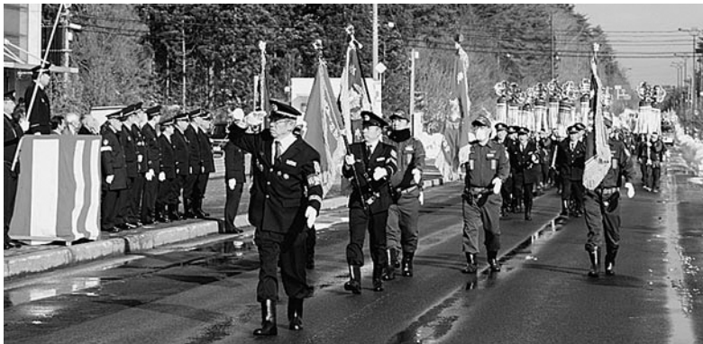
団長の指揮のもと一糸乱れぬ分列行進