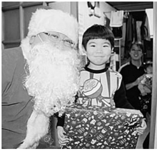
サンタクロースと記念撮影

12月24日(日)、クリスマス・イブの夜、東通村にサンタクロースがやってきました。サンタクロースは「メリークリスマス！」と大きな声で、村内7軒のお宅を訪問。子供たちは突然のサンタクロースにびっくりした様子でしたが、プレゼントを貰って、とびつきの笑顔がはじけていました。 今回のサンタクロースの訪問は、東通ライオンズクラブの皆さんが、子供たちの「サンタって本当にいるの？」という可愛い疑問や夢を守るために企画したもので、当広報誌で訪問家庭を募集し、今回で3回目の試みとなります。 サンタクロースは来年度もやってくる予定とのこと。今から良い子にして待っていないといけないですね。