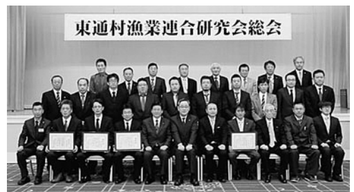
受賞者と来賓のみなさん