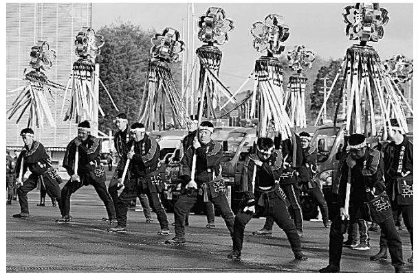
力強く華麗な纏振り