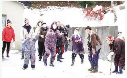
今年1年間の無病息災を祈願し、皆で一生懸命に拾います