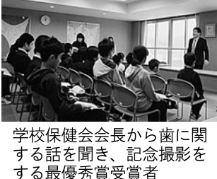
学校保健会会長から歯に関する話を聞き、記念撮影をする最優秀賞受賞者