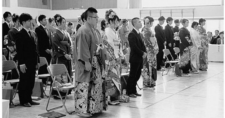
新成人として、気を引き締めて式に臨んでいました