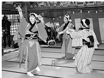
目名神社で披露された田植え餅つき踊り

1月15日(月)から16日(火)、村内各地で「田植えもちつき踊り」が行われました。 田植えもちつき踊りは、各地区の婦人会を中心に、古くは江戸時代から伝承されていると考えられているもので、小正月の伝統行事として披露されています。 当日は穏やかな天気の下、鮮やかな衣装を身に付けた女性たちが、各地区の家々を門付けして回りながら、1年間の家内安全や豊作を願って踊りを披露しました。 また今年も、踊りの様子を撮影しようと、県内外から村を訪れたアマチュアカメラマンやツアー客が、各地区を訪れていました。