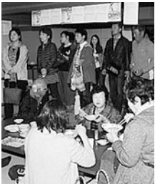
新そばを求め 大勢の来場者