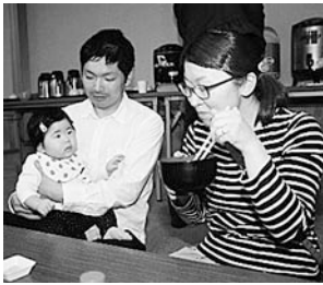
新そばの味を楽しむ ご家族

10月7日(土)～8日(日)の2日間、「ひがしどおり新そば街道まつり」が開催され、村内6地区(蒲野沢、砂子又、大利、小田野沢、鹿橋、目名)の会場は、新そばを求め大勢の来場者でにぎわいました。 このイベントは、東通村で収穫されたばかりの新そばを使い、各集落の会場で腕によりをかけて作った、風味豊かな、かけそばやざるそばを提供する催しです。 初日は、あいにくの雨でしたが、各会場には村内からのお客様の他に、お隣のむつ市や遠くは青森市などの村外からお越しの方も数多く見られ、会場によってはそばを