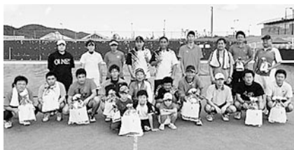
応援に駆け付けた家族も一緒に 記念撮影(ソフトテニス)

村体育協会加盟の各種目で、スポーツを通じて健康増進を図ると共に、親睦を深め、地域の仲間作りを目的に大会が行われました。 9月24日(日)ゲートボールとソフトテニス大会、そして10月1日(日)には硬式テニス大会が行われ、秋晴れに恵まれたスポーツ日和の中、各会場において熱戦が繰り広げられました。 ゲートボールでは、老人クラブや各地区のゲートボール愛好者が集まり、選手たちは皆、はつらつとした表情で競技を楽しんでいました。 ソフトテニス会場には、選手が家族が応援に駆けつけ、その子供たちは「パパ頑張つて！」と元気な声で応援し、選手たちは気合の入ったプレーで応援に答えていました。 硬式テニスでは、村内の高校生も交え、団体及び個人戦の交流試合となり、盛り上がりしました。 各競技の結果は下記のとおりです。