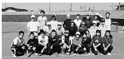
高校生・社会人共に健闘を称え合い 記念撮影(硬式テニス)