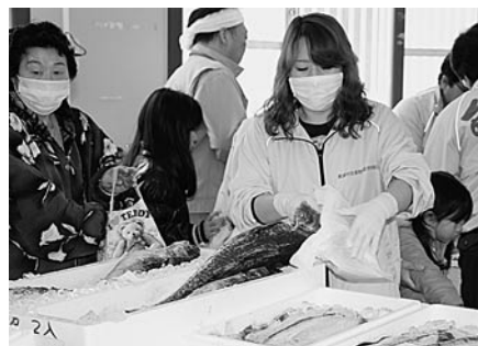
魚は当日獲れたてのものも