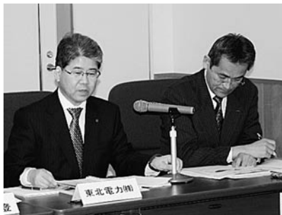
東北電力・東京電力から状況説明