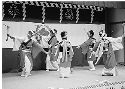
大利もちつき踊り保存会による「もちつき」