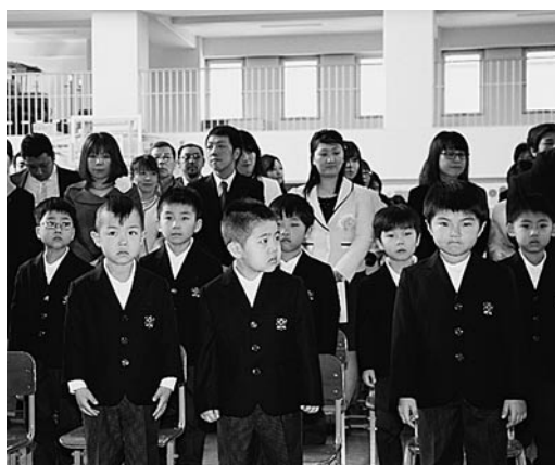
新しい学校に緊張気味の新小学生