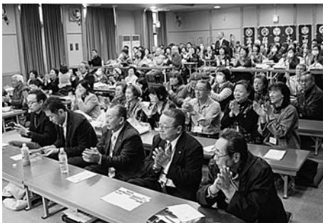
会場の観客からの惜しみない拍手

この会は来年も実施されるとのこと。初参加の来場者から「初めて来たが、想像以上に楽しめた。来年もまた来たい」との声が上がっていました。