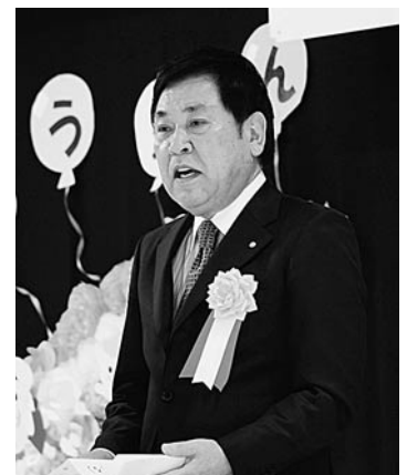
式辞を述べる越善村長