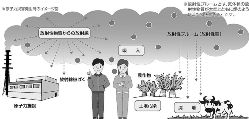
※放射性プルームとは、気体状の放射性物質が大気とともに煙のように流れる状態のことです。