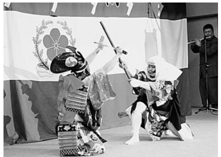
尻労後援会による「鞍馬」