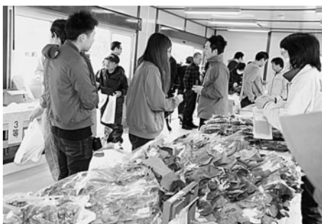
ホウレンソウの販売

直売所での農産物・海産物の販売は午前10時に開始され、大人気の尻屋産殻つきウニや、ババガレイ、マゾイ、タコ、岩ノリ、等の海の幸、ホウレンソウ、ジャガイモ、ネギといった山の幸も販売されています。鮮魚売り場ではババガレイやタコを、発泡スチロールの箱ごと、購入していくお客様の姿も見られました。毎月9のつく日は直売所とレストハウスへお越しください。