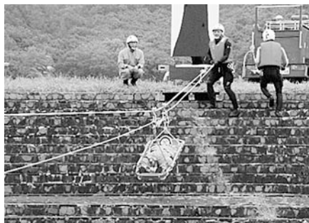
救助ロープによる救出活動