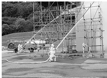
連携のとれた消火活動