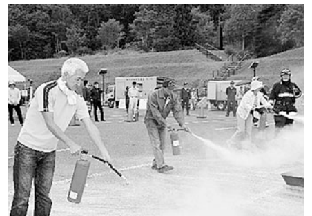
住民による初期消火訓練