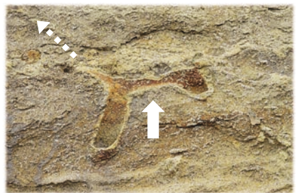
巣穴の縦の断面。左上(海面方向)に向かって伸びていたと考えられます。