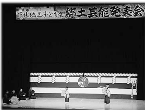
ライトアップされた舞台の上、大勢の観客の前で演じ切りました。