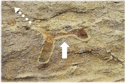
巣穴の縦の断面。左上(海面方向)に向かって伸びていたと考えられます。