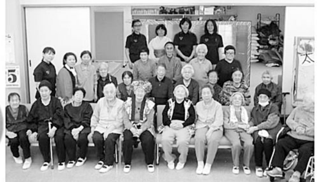
☆デイサービス利用者様、職員と☆