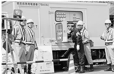
電源復旧を越善村長が確認