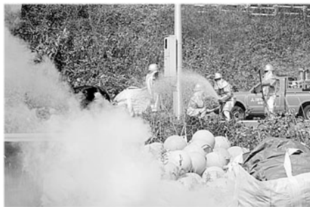
消防団・消防署・事業者による消火活動

ました。 その他にも、火災防御訓練、交通事故救出、炊き出し訓練など、災害発生に備えた各種の訓練を実施。訓練に参加した住民の方々も、消火器による初期消火訓練、AED(除細動器)による救急救命法の説明など、災害時の自衛・応急対策などを体験しました。 いろいろな訓練に参加し、災害時の対応や、防災意識の啓蒙に努めるほか、日頃から防災に対する意識を持ち、突然の災害にも冷静に対処できるよう、皆さんも日常の備えに気を配りましょう。