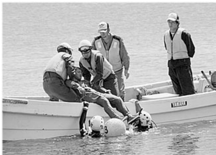
ダイバーによる海難搜索・救助