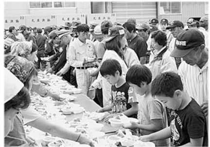
炊き出し訓練では自衛隊のカレーが提供されました。