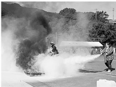
住民による初期消火訓練