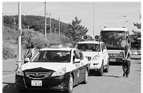
避難は警察や広報車両が先導