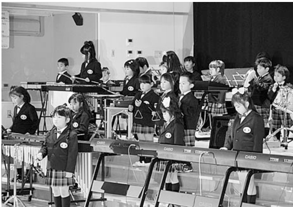
こども園ひがしどおり