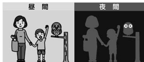
反射材用品等を着用しない場合

反射材は、50メートル以上離れた車からでもライトを反射するので、ドライバは早めにも歩行者の存在に気付くことができます。 夕暮れ時や夜間に外出するときは、交通事故防止のため、反射材用品を身に付けましょう。