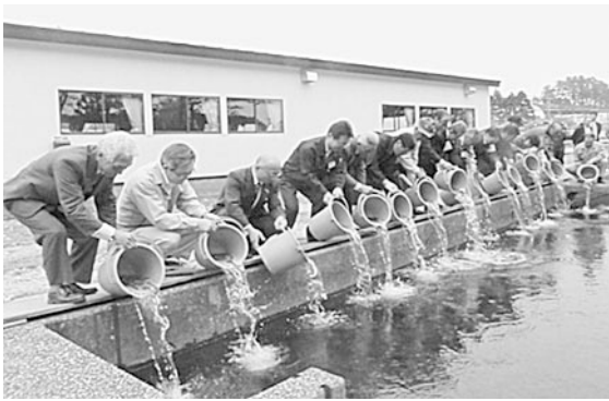
関係者による放流

幼魚や稚魚放流を実施することで、沿岸海域での水揚げと河川回帰の増大に、大いに期待がもてるものと思われれます。