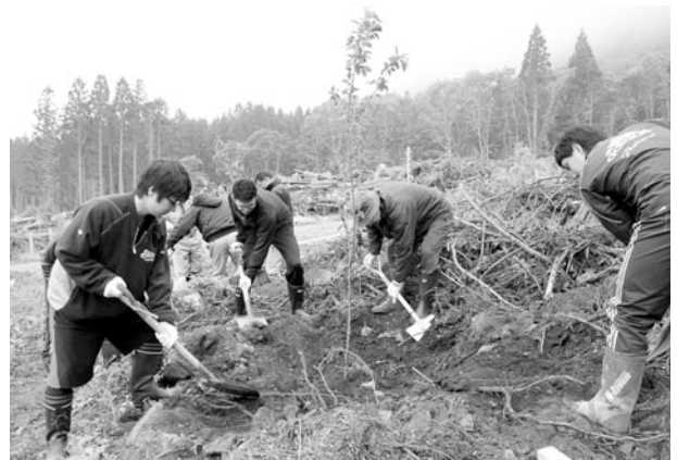
立派な木に育つよう願いを込めながら、ていねいに植樹しました