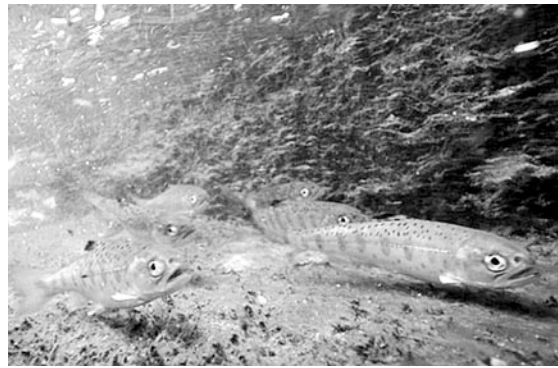
放流されたサクラマス幼魚（当日の水中写真）