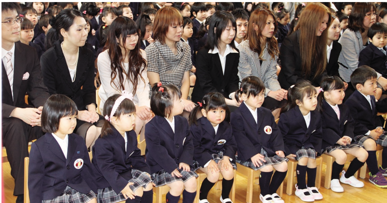
【こども園ひがしどおり】