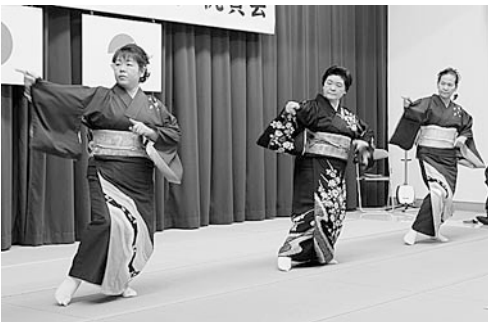
地域の方々による郷土芸能が披露されました