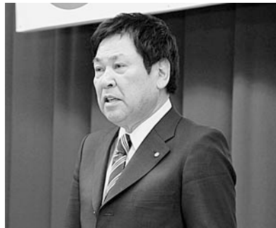
式辞を述べる越善村長