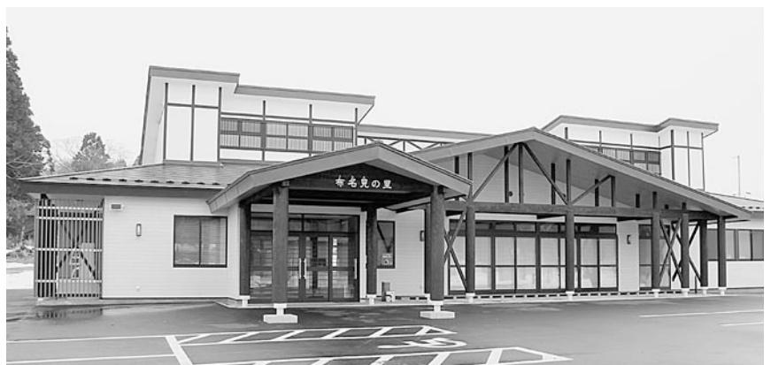
完成した「布名見の里」