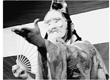
蒲野沢青年会「翁舞」

◇日時・出演団体 ※公演日時・出演団体は会場や出演団体の都合により予告無く変更になる場合があります。