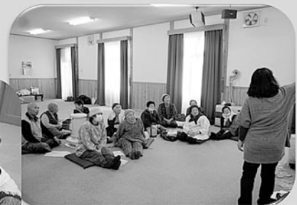
皆さん一緒に昼食タイム♪