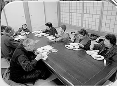
食事バランスのお話し☆ 皆さんしっかり聞いています。