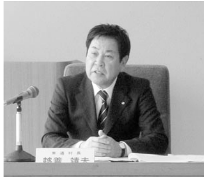
防災会議会長（越善村長）

今後、最新の知見等を反映しつつ、計画の修正を行なっていくこととしております。村としては、今後も引き続き、原子力防災体制の充実・強化に努めてまいります。東通村地域防災計画（原子力編）の修正内容については次ページに紹介しておりますのでご覧ください。