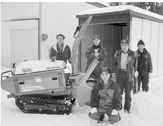
助成事業で購入した除雪機と物置

助成を受けた大利部落会では、除雪機1台、シャッター付物置1棟を購入し、機械を貸し出したり、老人や一人暮らし世帯の除雪作業に役立てる予定です。集落内の交流が活発になり、連帯感に基づく自治意識の向上、コミュニティのさらなる発展に期待しています。