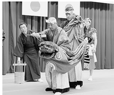
目名神楽会による屋固め