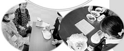
ご飯量を量りました!

1回のごはん量の目安は、130〜150Kcal(活動量で異なります)となります。