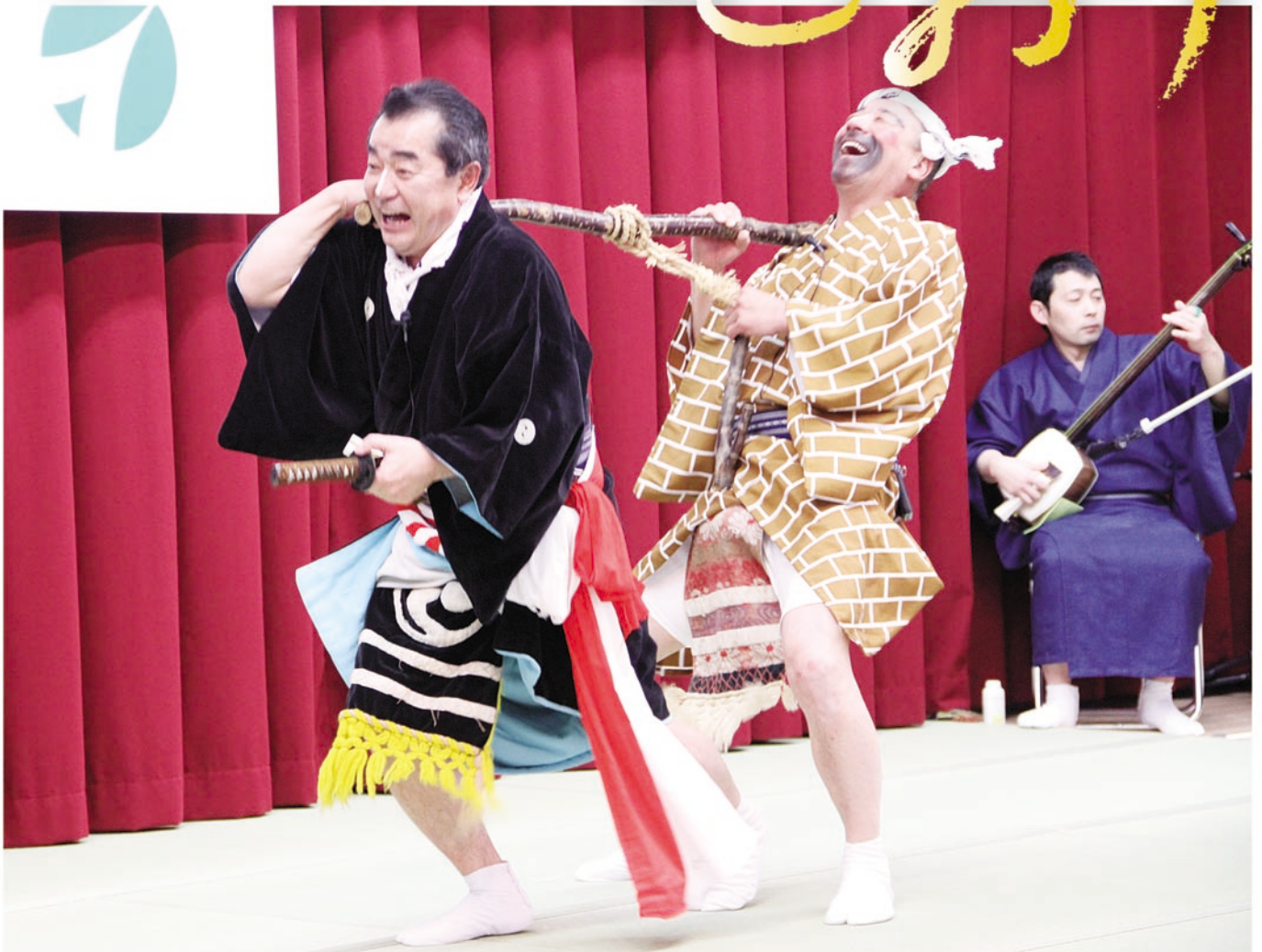
(写真は目名神楽会「かべぬり」)