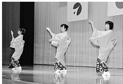
大利婦人会「つきあげ」