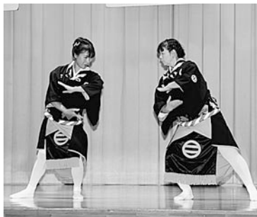
老部婦人会「どどいつ」