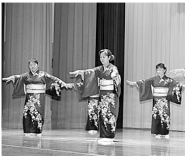
石持婦人会「東通音頭」

また、演目終了後には各婦人会員が持ち寄った様々な景品が当たる「お楽しみ抽選会」が行なわれ、訪れた観客は最後まで楽しんでいました。