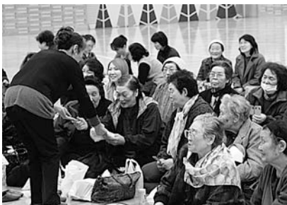
大好評のお楽しみ抽選会