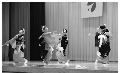
小田野沢婦人会「もちつき踊り」