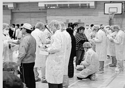
②放射性物質の付着の有無の検査