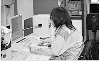
防災無線による広報