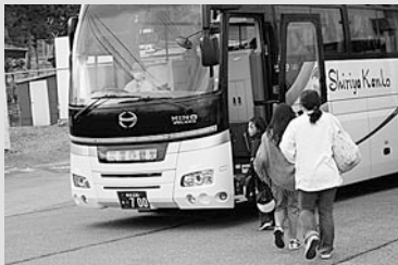
避難車両へ乗車（一時集合場所）