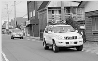
広報車などによる巡回広報