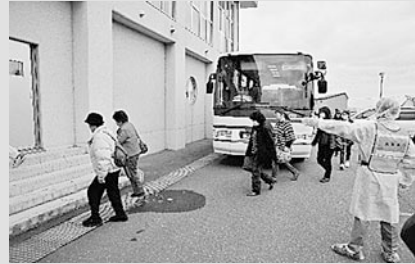
避難場所（東陽小学校）へ到着