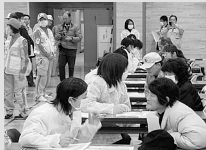
③避難前の状況などを確認する問診