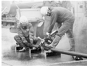
水道管漏水復旧訓練