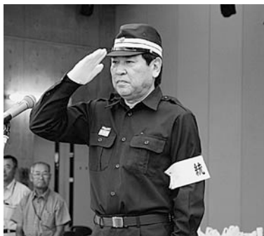
災害対策本部長の越善村長