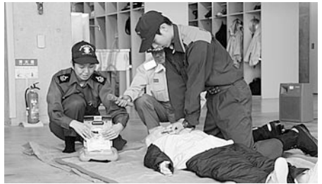
AEDを用いた救命法の実演