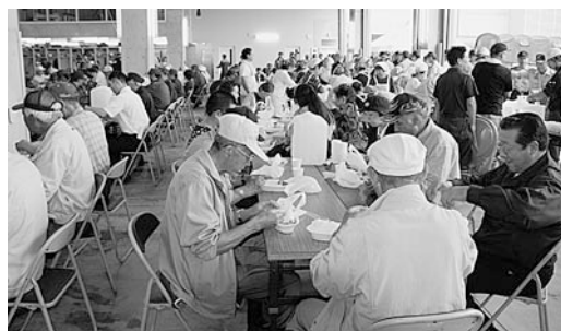
訓練終了後は炊き出しのカレーを食べました