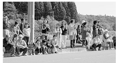
沿道には多くの方が応援に駆けつけました