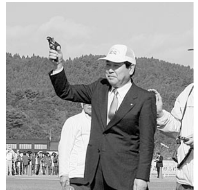
スタートの合図をする越善村長