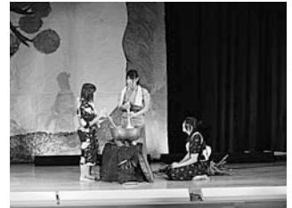
クジラの海をめぐる物語 演劇「伊佐魚取り」