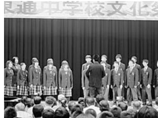
学級合唱グランプリは 3年1組「蒼い砂漠」