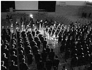
厳かな雰囲気 のオープニングセレモニー

10月17日(日)に第3回東通中学校文化祭を開催しました。限られた時間での練習でしたが、とても内容の充実したものになったと考えております。ステージ発表では、吹奏楽部の素晴らしい演奏や他校にも誇れる質の高い合唱コンクールなどが見る人たちを魅了しました。英語スピーチや弁論など、日ごろの生活では見られない個性や特技を披露し、文化祭に花を添えました。展示の部では美術、技術、家庭科など、授業で取り組んだ力作が並びました。まさに生徒一人一人の学校生活での頑張りの結果が見られました。このように立派な文化祭ができましたのは、生徒会を中心とした全校生徒の頑張りはもちろんですが、参加頂いた保護者、地域の皆様のおかげと深く感謝いたしております。今後とも、東通中学校の教育推進にご協力・ご支援をよろしくお願いいたします。