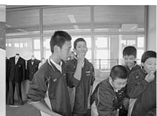
生徒からは上々の感想