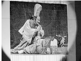
能舞をモチーフにした モザイクアート