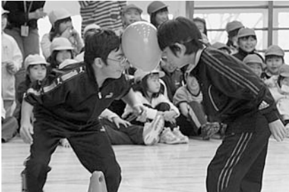
5・6年生は顔で風船リレーをしたよ。

12月20日(月)にひとみ集会が行われました。全校児童で学年の枠を超えて楽しくゲームを行いました。児童らからは「またやりたいです。」「他の学年の人とも仲良くなれてうれしかったです。」「楽しいゲームを考えてくれた運営委員会のみなさん、ありがとうございました。」等の感想がありました。