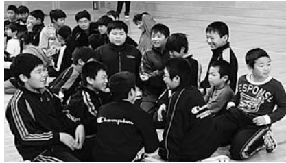
猛獣狩りゲームの様子