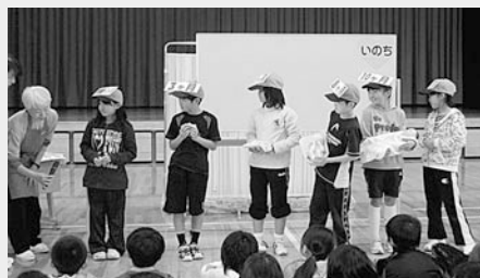
お腹の中の胎児の様子について話を聞く様子。