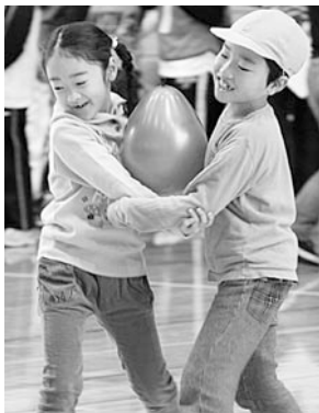
1・2年生はお腹で風船リレーをしたよ。