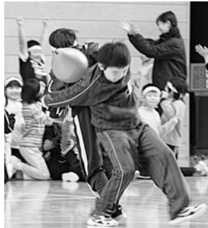
3・4年生は背中で風船リレーをしたよ。