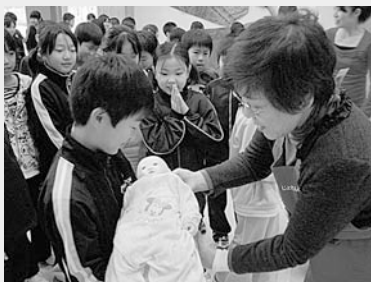
人形の赤ちゃんを抱っこする様子。 ドキドキしてうれしかったよ！

11月30日(火)に第4回すこやか会議が行われました。今回は日本助産師会青森県支部性教育プロジェクト「あかり」の助産師による「いのちのお話」出前講座が行われました。 4年生の児童68名と保護者、教職員が参加して「いのちのお話」を聞きました。話を聞かたびに児童らからは「へえ～」、「そうなんだ」などの声が聞かれ、興味深く真剣に話を聞いていました。また、最後に赤ちゃん人形を抱っこする時にはみな笑顔でした。