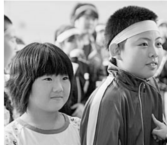
O×クイズの様子 正解は…どっちかな？