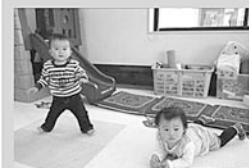
ゴロゴロしてみたり