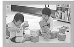
ブロック遊びをしたり