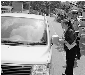
多くの方々に参加いただき安全運転を呼びかけました

遡があり、同協議会役員やむつ警察署、村交通安全母の会、むつ地区交通安全協会、村交通安全指導隊など約30人が、ドライバーの皆さんに安全運転を呼びかけました。 夏は車の利用が多く、また、子ども達も外で遊ぶ機会が多くなります。ドライバーの方はもちろんのこと、歩行者の方も車に十分気を付け、交通事故のない楽しい夏を過ごしましょう。