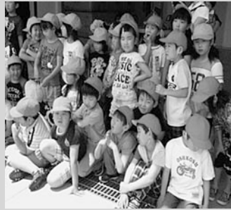
6月18日(土) 親子で消防署見学に行きました。