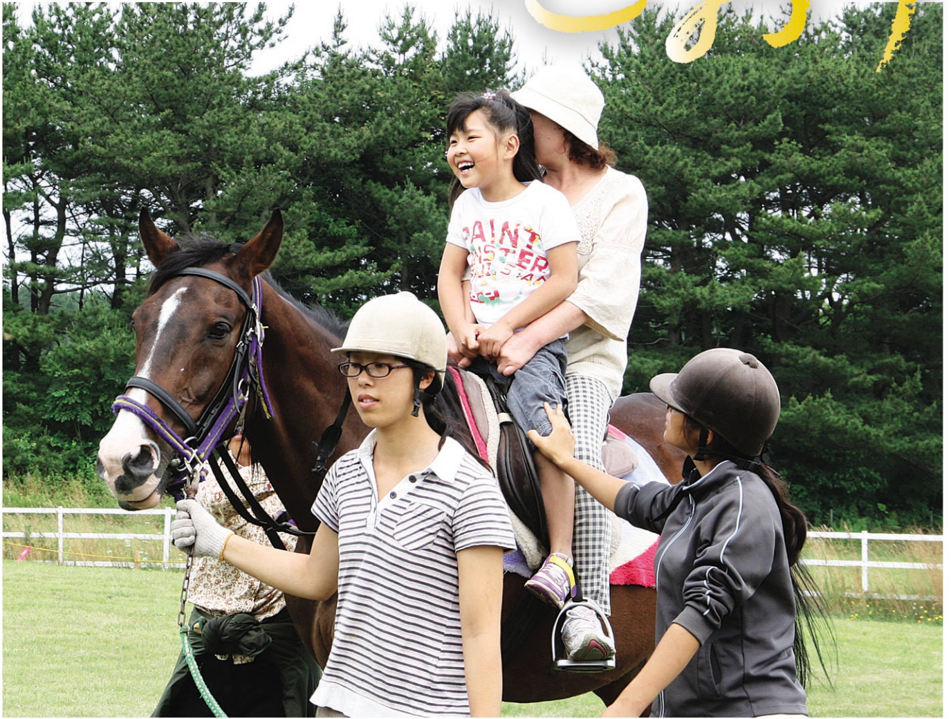
【関連記事 3 ページ】