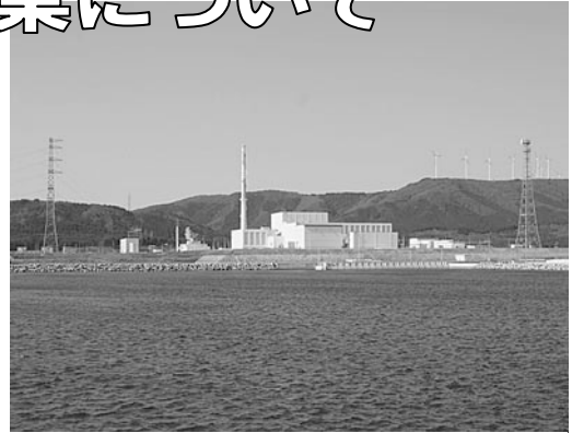
▲東北電力(株)東通原子力発電所1号機