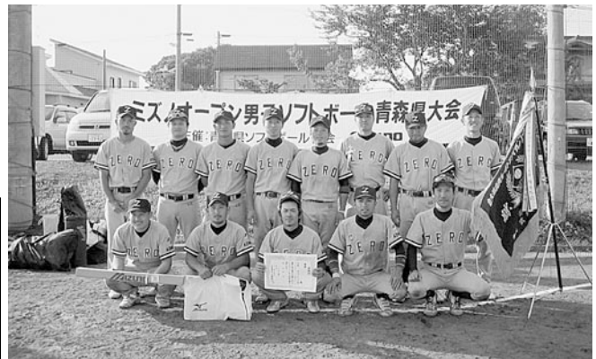
ZEROの皆さん、優勝おめでとうございます!