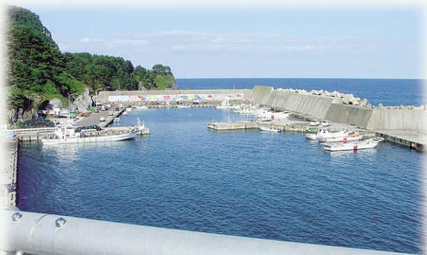
橋から見た尻労漁港

みなさんも自分の住んでいる地区とは違う場所を訪ねてはいかがでしょうか？新しい発見が必ずありますよ！！