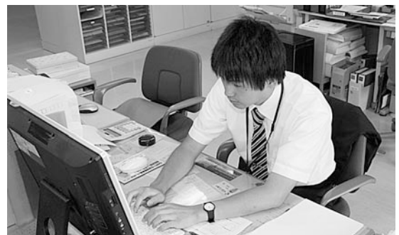
10日間お疲れ様でした!