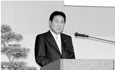
式辞を述べる越善会長