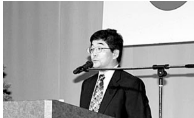
講演をする長津氏